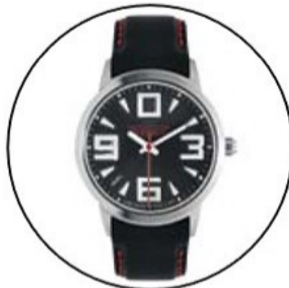
«Петродворцовый Классик» «Petrodvorets Classic»