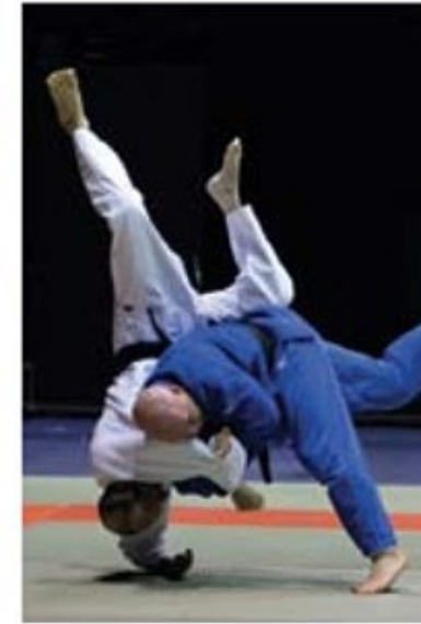
Athletes supporting "Raketa"