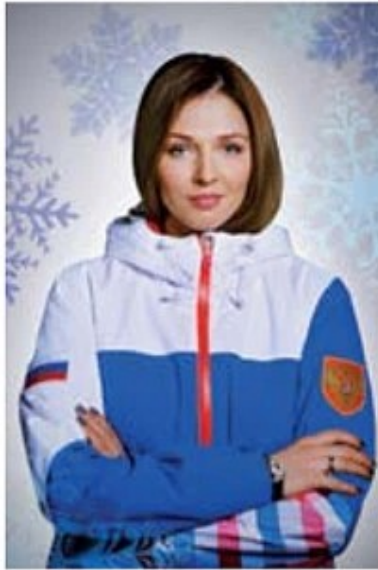
Спортсмены поддерживают "Ракету"